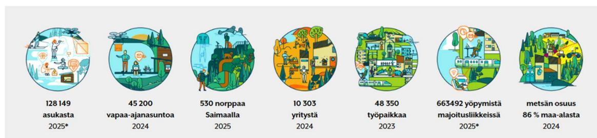
KUVA 3. Etelä-Savon aluekehityksen tilannekuva, valikoituja indikaattoreita.

Työ on hyvin vahvasti verkostotyötä. Keskeisiä sidosryhmiä ovat alueen koulutus- ja tutkimusorganisaatiot, julkishallinto mm. elinvoimakeskus ja työllisyysalueet, kunnat ja kehitysyhtiöt, hyvinvointialue, elinkeinoelämä, kauppakamari, rittäjät, muut järjestöt, kansalaiset ja media.