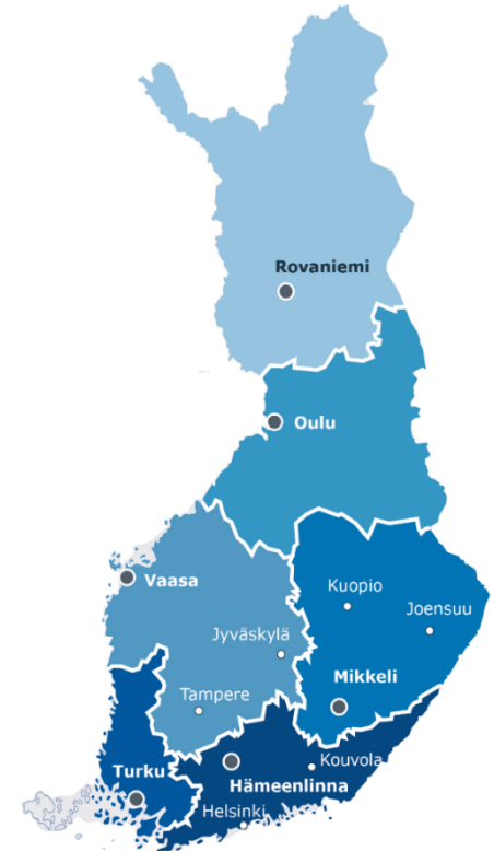
Aluehallintovirastojen nykyiset toimipaikat