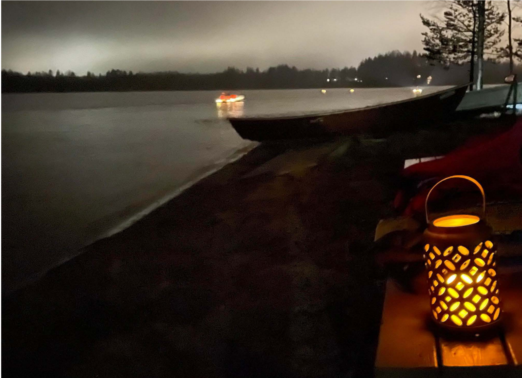
Valomelontaa ja runovalopolku Juvalla Syys-Vetehisillä.