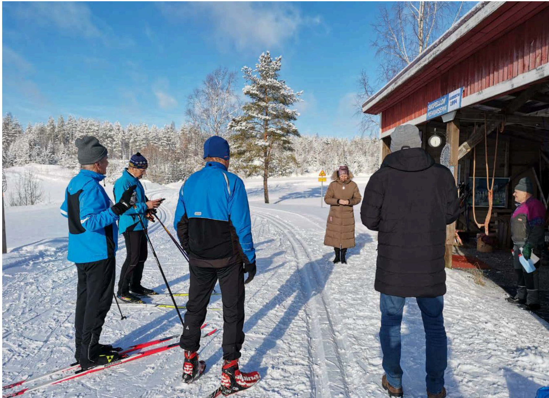
Taideteko puhtaan järviluonnon puolesta Suopellon mehuasemalla Mäntyharjulla Talvi-Vetehisillä.