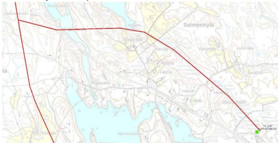
Kuva 2. Puuttuva voimajohtokäytävä Kangasniemi (Sammakkoniittu - Lapaskangas). Kyseessä suurjänniteilmajohto (110 kV).