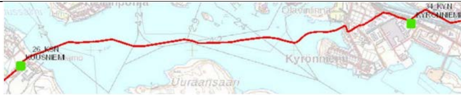
Kuva 1. Puuttuva voimajohtokäytävä Savonlinna (Kuusniemi – Kyrönniemi). Kyseessä suurjännitekaapeli (110 kV), joka toteutettu osittain sekä maa- ja vesikaapelina.